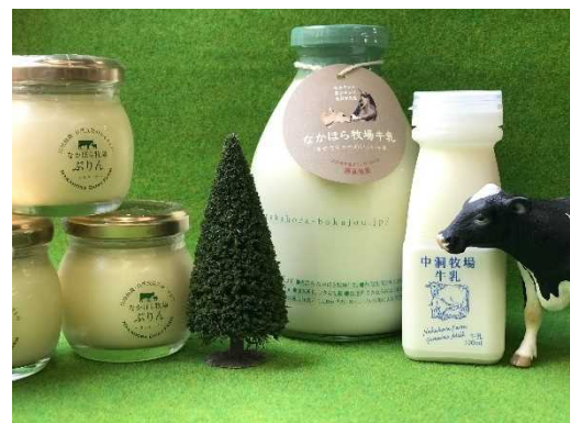
『しあわせな牛からすこやかで美味しい牛乳』 山地酪農をされている なかほら牧場様の乳製品

要するに、それまで幸せだと思っていても、他の人と比べ始めたときに幸福度が下がることもあれば、逆に他の人に災難などがあれば自分はまだいい方だと思って幸福度が上がることもあるのです。近年は特に、SNSの普及などにより、他