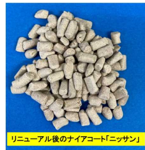
リニューアル後のニアコート「ニッサン」

試験開始日の乳量を0として、乳量の推移を見てみますと、暑熱期においても給与群では乳量の減少が、無給与群に比べて抑えられていました。朝夕の乳量で比較しますと、朝の乳量は給与群で常に多く、両群ともに、その変動も緩やかでした。一方、夕方の乳量は給与群で多かったものの、両群ともに日によって大きく変動する傾向にあり、日中の暑熱の影響が大きく表れることがうかがえました。トータルの乳量を比較しますと、試験開始日からの平均乳量の減少は、給与群で-1.7kgであっ